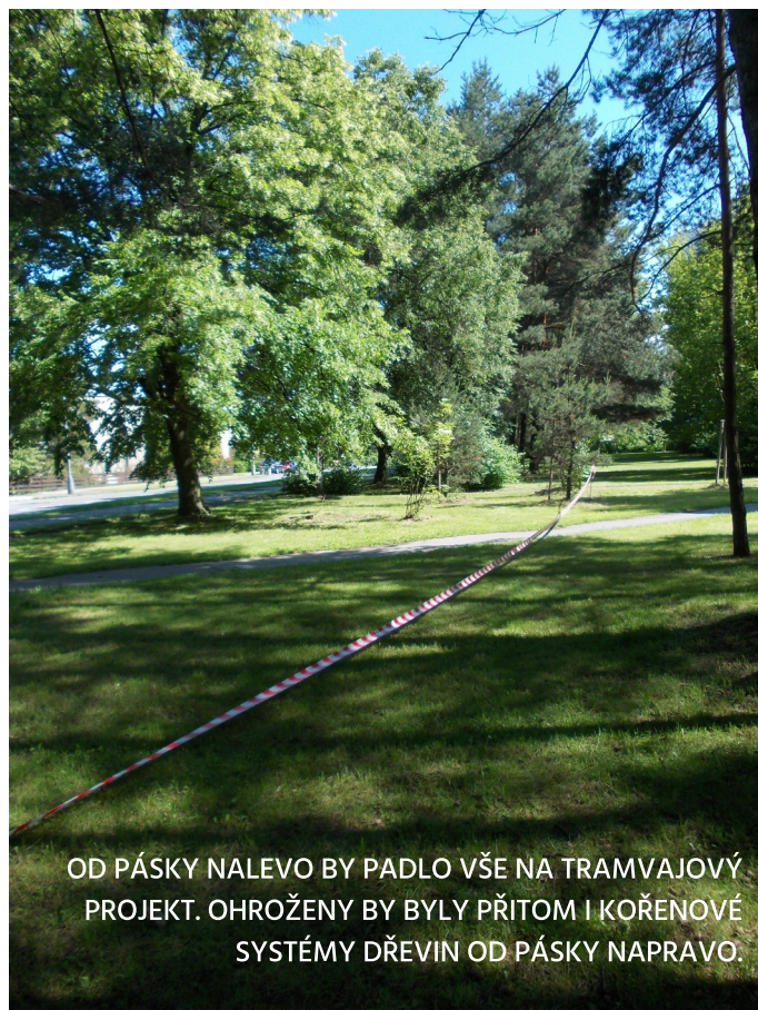
OD PÁSKY NALEVO BY PADLO VŠE NA TRAMVAJOVÝ PROJEKT. OHROŽENY BY BYLY PŘITOM I KOŘENOVÉ SYSTÉMY DŘEVIN OD PÁSKY NAPRAVO.

Na veřejném projednávání vyšlo najevo, že část dokumentace pro tramvajový záměr je plagiát. Předložené studie o hluku a rozptylových podmínkách se ukázaly jako zastaralé a neprůkazné co do zlepšení životního prostředí. Projekt by si navíc vyžádal velké kácení stromů a zabor volné půdy, kde žijí různí živočichové.